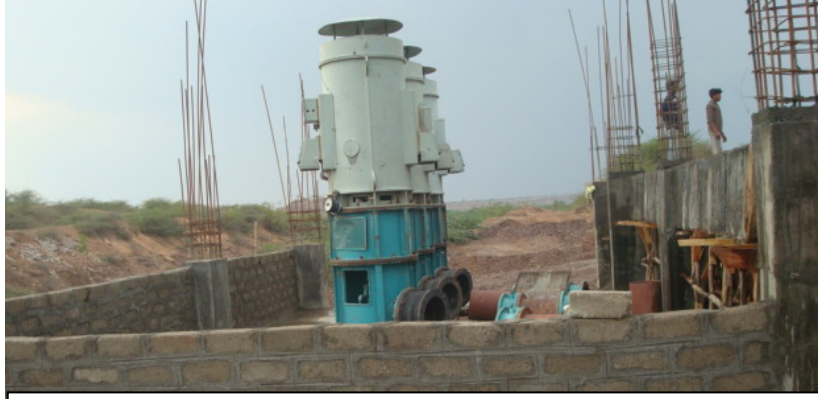
ರಾಜನಕೊಳ್ಳೂರು ಏ.ನೀರಾವರಿಯ ಜಾಕ್ವೆಲ್-ಕಂ-ಪಂಪ್ ಹೌಸ್