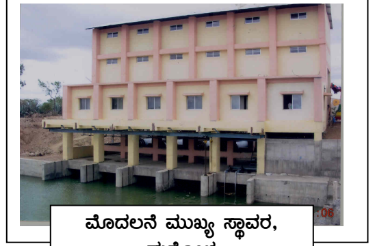
ಮೊದಲನೆ ಮುಖ್ಯ ಸ್ಥಾವರ, ಮರೋಳ