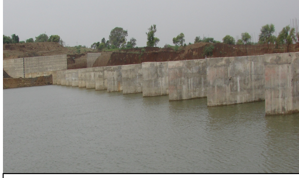
ಪ್ರಗತಿಯಲ್ಲಿರುವ ಚಂದಾಪೂರ ಬ್ಯಾರೇಜು