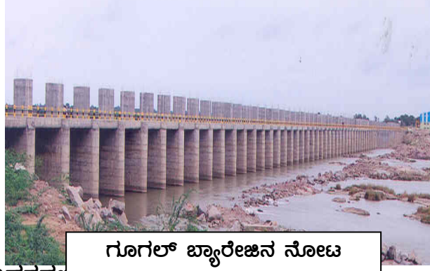
ಗೂಗಲ್ ಬ್ಯಾರೇಜಿನ ನೋಟ