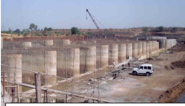
ಪ್ರಗತಿಯಲ್ಲಿರುವ ಮಾಣಿಕೇಶ್ವರ ಬ್ಯಾರೇಜು